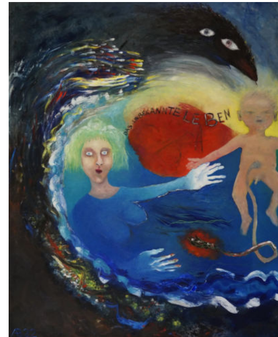
„Das unbekannte Leben“, Anna Bieler ©VG- Bild-Kunst, Bonn 2025