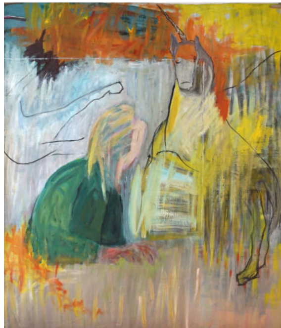
„einsam sucht sie nach dem Einhorn“, Kristin Pfaff-Bonn