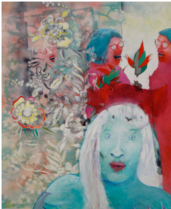
„Lebensblüten“, Anna Bieler ©VG-Bild-Kunst, Bonn 2025

In Zusammenarbeit mit dem Frauenzentrum Mainz soll das Thema unserer Ausstellung ‘Zwischen Hyaluron und Analgetika’ in Diskussionen und Lesungen an den Ausstellungsorten vertieft und sichtbar gemacht werden.